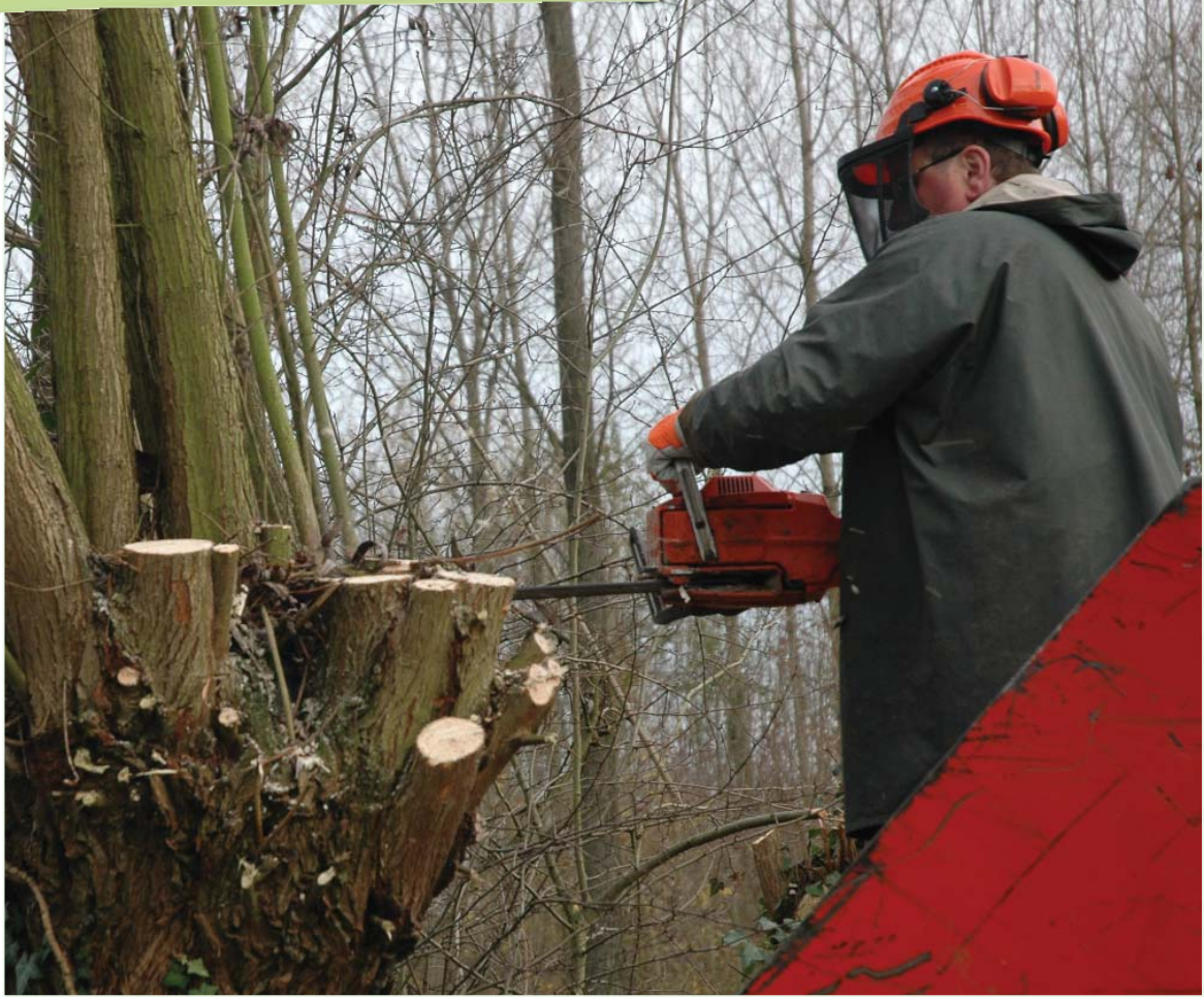
Onderhoud trage wegen